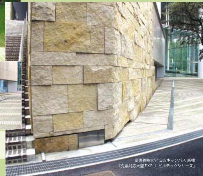
慶應義塾大学 日吉キャンパス 新棟 『免震対応大型EXP.J.ビルテックシリーズ』