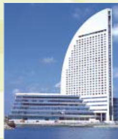
みなとみらい21 パシフィコ横浜 『バラEX-U』