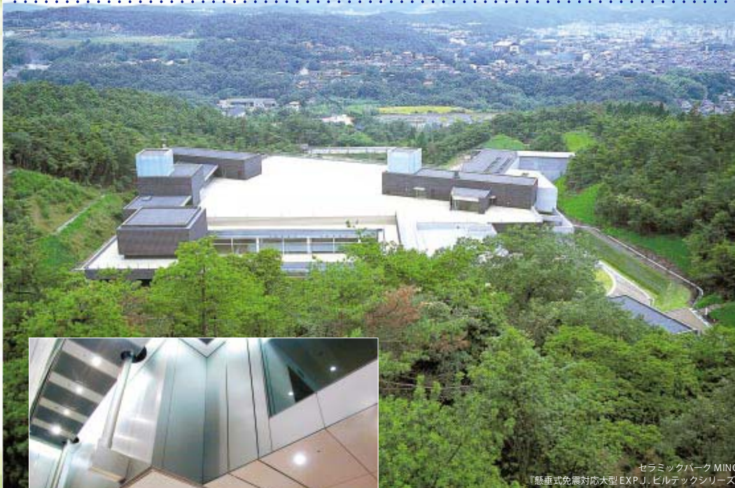
セラミックパーク MINO 『懸垂式免震対応大型EXP.J.ビルテックシリーズ』